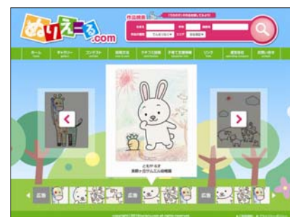
「ぬりえ～る.com」ギャラリーページ

また「ぬりえ～る」とともにオフィシャルサイト『ぬりえ～る.com』を開設し、作品の投稿や“ぬり絵コンテスト”を開催する。作品の投稿は郵送でもできるが、主に携帯電話で行うようにし、作品投稿の煩雑さを軽減。携帯電話に慣れ親しんだ現代の子育て世代が気軽に投稿できるようにしている。『ぬりえ～る.com』で子どもの作品を公開することで、子どもの成長記録を遠方の親族や保護者の友人に広く見せることができるのも「ぬりえ～る.com」の大きな魅力である。